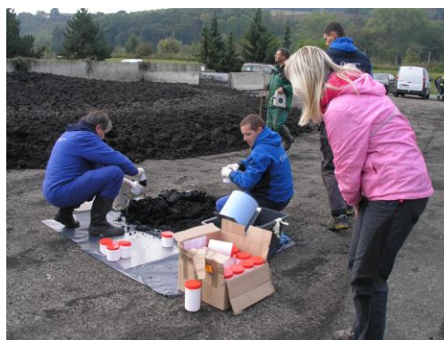
Obrázek č. 5 Příprava kontrolního vzorku