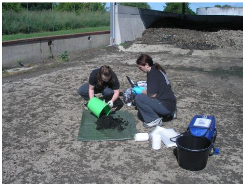
Obrázek č. 3 – Příprava k dělení vzorku