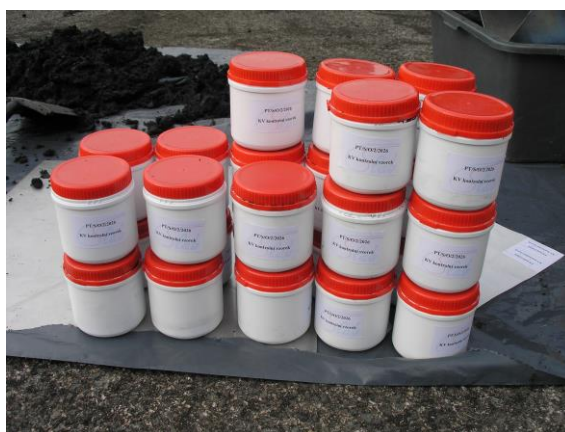
Obrázek č. 6 Kontrolní vzorky

Laboratoře odebraly dva směsné vzorky čistírenského kalu pro stanovení vybraných ukazatelů v souladu s požadavky platných právních předpisů, každý odebraný vzorek analyzovaly dvakrát a celkem poskytovatel obdržel čtyři výsledky. Dále od poskytovatele PT obdržely kontrolní homogenní vzorek čistírenského kalu připravený na místě konání (vzorek odebrala jedna odběrová skupina na lokalitě, byl zhomogenizován a rozdělen jednotlivým účastníkům pro stanovení obsahu analytů), a distribuce zakoupeného referenčního materiálu.