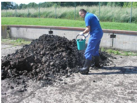
Obrázek č. 2 – Vzorkování Kroměříž

kde n = 4 - 30 , V objem v m^3 , n_{sp} - počet jader.