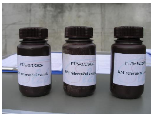
Obrázek č. 4 Referenční materiál